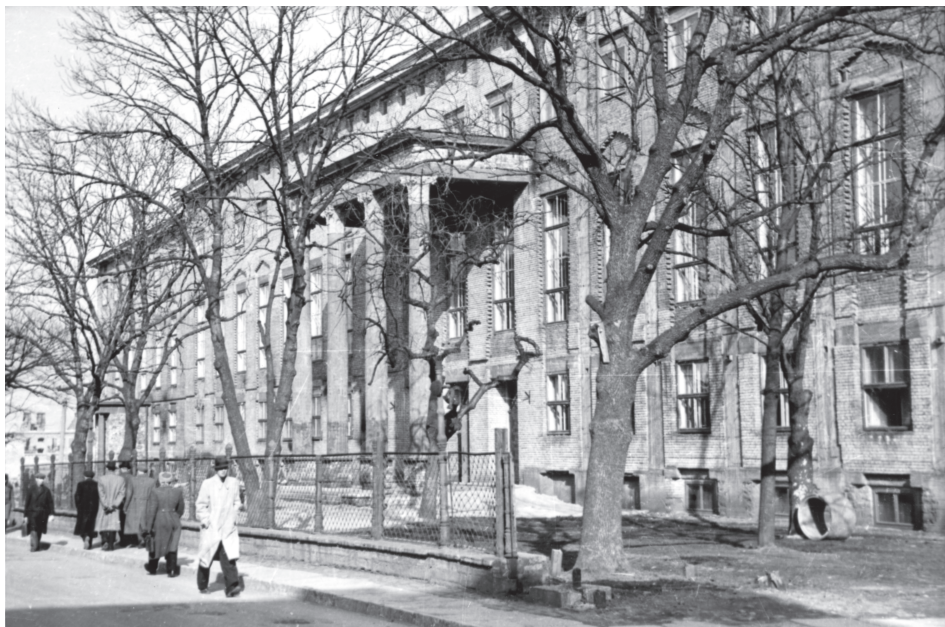
Tallinnas, Sakala tänaval (Eesti arhitektuurimuseumi kogudest)