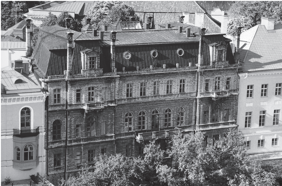
Akadeemia maja (Tallinn, Kohtu 6), vaade Pika jala poolt