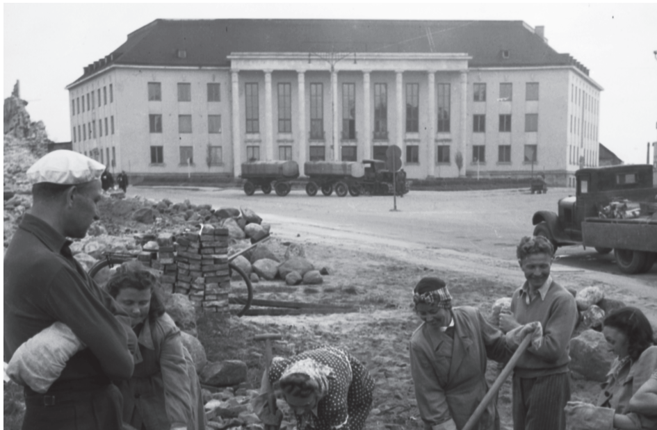
Tartus, Riia tänaval