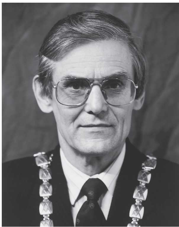
Jüri Engelbrecht Akadeemia president 1994–2004

assotsieerunud teadusasutusi finantseeritakse ministeeriumide, Eesti Teaduse Sihtasutuse, teiste riiklike fondide ning riiklike programmide kaudu ja muudest allikatest 817 . Samuti oli rahalistel põhjustel valitsuse ainupädevusse antud õigus otsustada akadeemikute arvu üle (akadeemikutasu!), sest riigi rahaline seis polnud kiita. 818